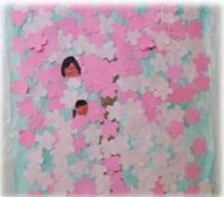
貼り絵で桜を作りました。 浦田の桜にも負けない、 世界に一つだけの桜が完成♪

新年度がスタートし、1ヶ月が過ぎました。 早くコロナウイルス感染症が収束して、またいろいろな場所に出かけることができるとなることを願っています。