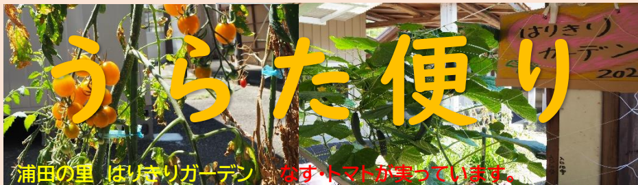
浦田の里 はりきりガーデン なす・トマトが実っています。