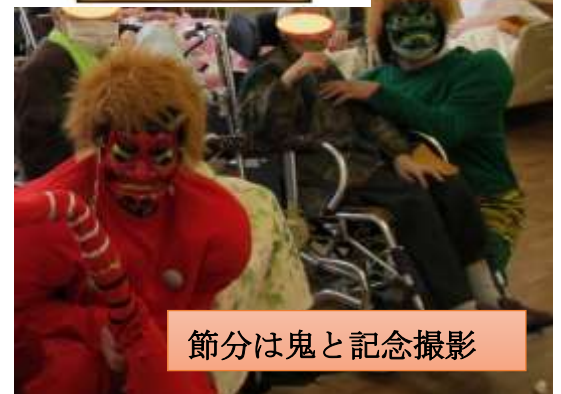
節分は鬼と記念撮影